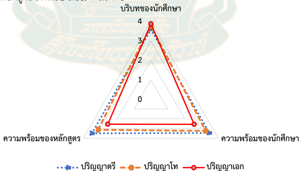
ภาพที่ 4.2 ภาพรวมของปัญหาและข้อเสนอแนะในการศึกษาทางไกลของยุคปกติใหม่

โดยภาพรวม นักศึกษามีปัญหาในการศึกษาทางไกลในยุคปกติใหม่ ในภาพรวมอยู่ในระดับปานกลาง (ค่าเฉลี่ย 3.30) เมื่อพิจารณาในแต่ละประเด็นด้าน พบว่า อยู่ในระดับมาก จำนวน 1 ประเด็น คือ ปัญหาเกี่ยวกับบริบทของนักศึกษา (ค่าเฉลี่ย 3.75) อยู่ในระดับน้อย จำนวน 2 ประเด็น ได้แก่ ปัญหาเกี่ยวกับความพร้อมของนักศึกษา (ค่าเฉลี่ย 3.08) และปัญหาเกี่ยวกับความพร้อมของหลักสูตร (ค่าเฉลี่ย 3.06) ตามลำดับ